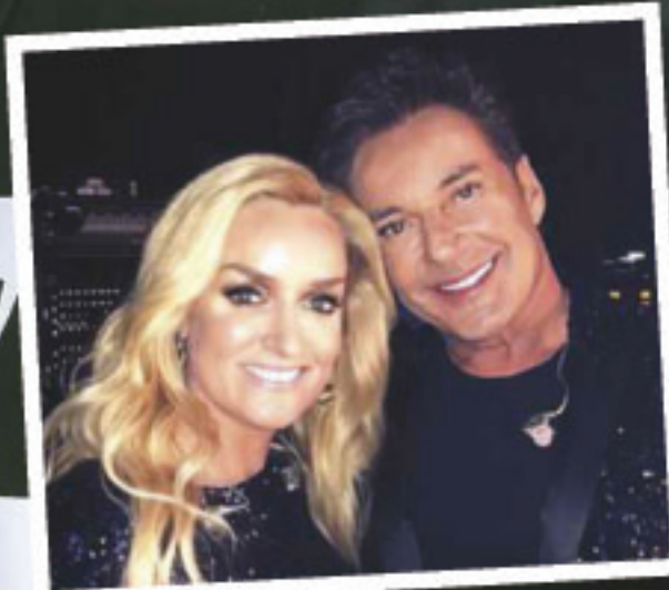
Samantha is dol op Geer. "Ons contact gaat verder dan alleen de muziek."

beledigende en sarcastische uitspraken door de jaren heen een afkeurende mening over Gordon hebben, moge duidelijk zijn. Dat over Gerard vaak milder gedacht wordt, blijkt als we de uitspraken van Samantha Steenwijk in 'Nieuwe Revu' lezen. "Ons contact gaat verder dan alleen de muziek. We komen ook bij elkaar thuis. Geer zei eens dat ik misschien wel de beste zangeres van Nederland ben en dat ik moet doorbreken. Daar heeft hij me bij geholpen. Sindsdien hebben we wekelijks contact, er is echt een leuke vriendschap gegroeid. Gerard vind ik de grootste artiest van ons land als je kijkt naar hoe hij met zijn fans omgaat. Hij is enorm benaderbaar en altijd een lieverd. Dat hij ontstemd is over sommige dingen in het boek van Gordon, kan ik begrijpen. Als je van alles meemaakt samen, ga je er niet vanuit dat iemand dat later allemaal in een boek gaat publiceren."