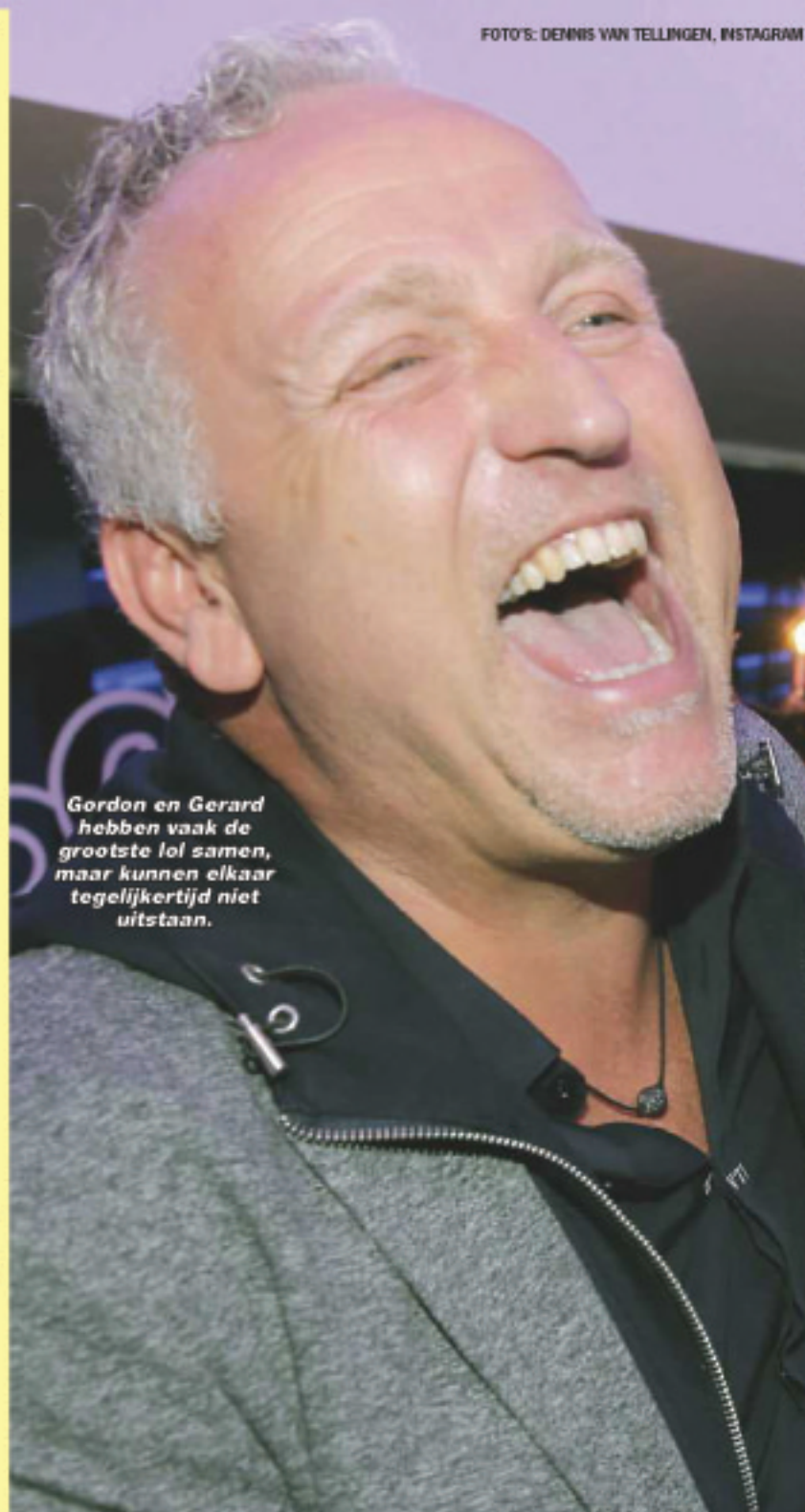
Gordon en Gerard hebben vaak de grootste lol samen, maar kunnen elkaar tegelijkertijd niet uitstaan.

Dat veel mensen door het verschijnen van zijn boek én door zijn